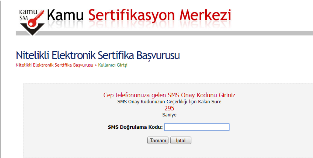
Şekil 4 - SMS Doğrulama Kodu

SMS Onay Kodu giriş ekranındaki SMS Doğrulama Kodu alanına cep telefonuna gelen SMS Onay Kodu girilir ve Tamam butonuna basılır. ( Şekil 4 )