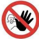
Yetkisiz kimse giremez