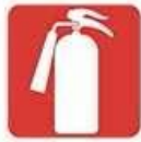
Yangın Söndürme Cihazı