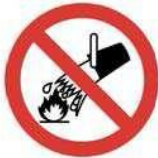
Suyla söndürmek yasaktır