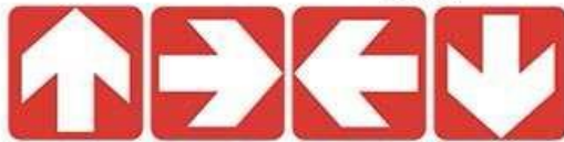
Yönler (Yardımcı bilgi işareti)

Bakım – onarım yapılan yerlerde ya da girilmesi istenilmeyen yerlerde barikatlarla ayrılmalı. Atölyelerde uygun yerlere iş güvenliği, iş kazaları, makine kullanımlarına ait bilgilendirici ve uyarıcı levhalar asılmalıdır. Aşağıda benzer örnekler verilmiştir.