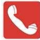
Acil Yangın Telefonu