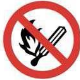
Sigara içmek ve açık alev kullanmak yasaktır